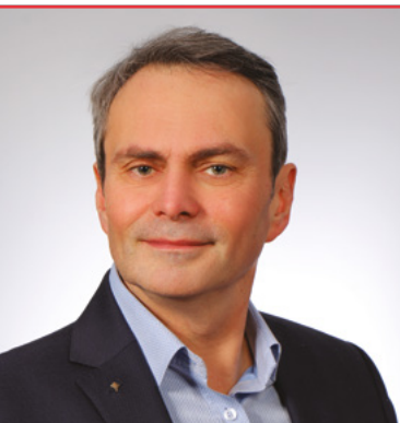
Tomasz Ciodyk – Prezydent Polskiej Federacji Stowarzyszeń Rzeczoznawców Majątkowych

Podstawa wyceny zależy od tego, jakie podejście stosuje przy wycenie rzeczoznawca majątkowy. W podejściu porównawczym wycena następuje na podstawie cen nieruchomości podobnych, które były przedmiotem sprzedaży na analizowanym rynku. Podejście dochodowe bazuje na możliwym do uzyskania dochodzie z nieruchomości, którym jest najczęściej możliwy do uzyskania czynsz najmu lub czynsz dzierżawny. Z kolei w podejściu kosztowym wartość nieruchomości odpowiadać będzie kosztom jej odtworzenia pomniejszonym o wartość zużycia. Wynikiem zastosowania podejścia porównawczego i dochodowego jest tzw. wartość rynkowa nieruchomości, czyli mówiąc w skrócie: szacunkowa kwota, jaką można uzyskać za nieruchomość przy sprzedaży na warunkach rynkowych.